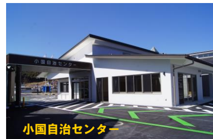
小国自治センター

【町指定文化財】…木造釈迦如来坐像・見田の荒屋不動 潮音寺の観音堂・太平寺仏殿 両化神社の夕顔切り・太平寺仁王門 見田の荒屋不動