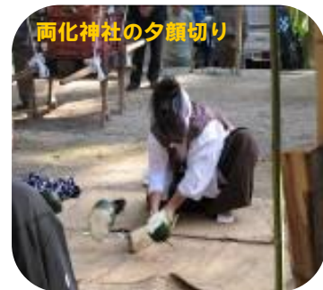
両化神社の夕顔切り